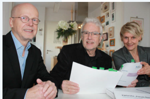
Vorstand Förderverein FORUM RECHT e. V.:

Weitere Infos unter: www.forum-recht-karlsruhe.de